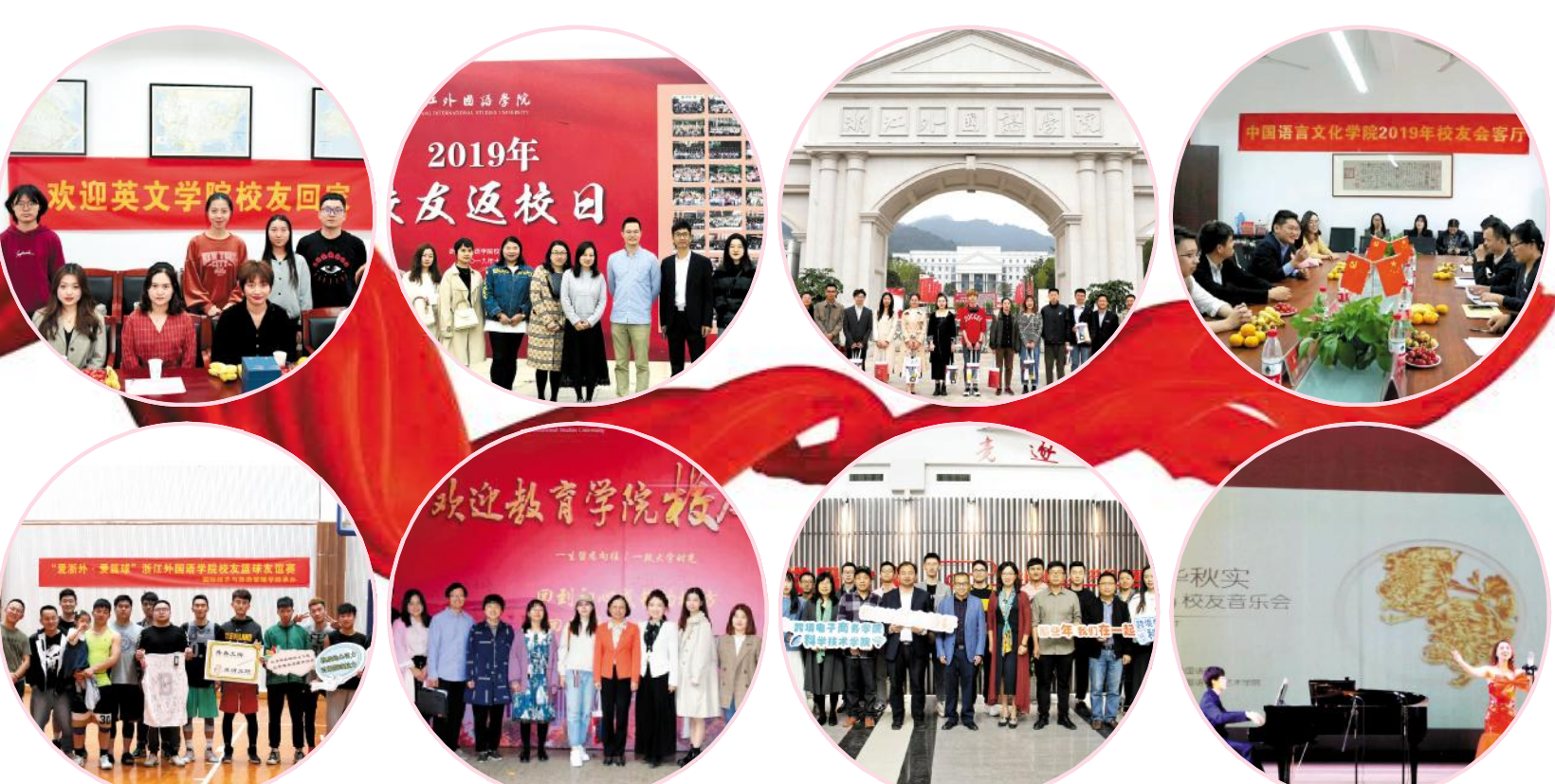
本报编委会主任:赵文波 副主任:徐勇 主编:田俊杰 副主编:李娟 杨秀中 浙江外国语学院编辑部出版

“今天的开幕式有点堵啊,到处都是我们浙外人……”在俏皮的开场白中,校友们欢聚厚德楼307,畅叙友谊,共话旧情。会上,合作处负责人向各位校友介绍了近年来我校在校友会、教育发展基金会、学校发展方向等方面的具体情况,校友们认真聆听,时而点头认同,时而低头记录。