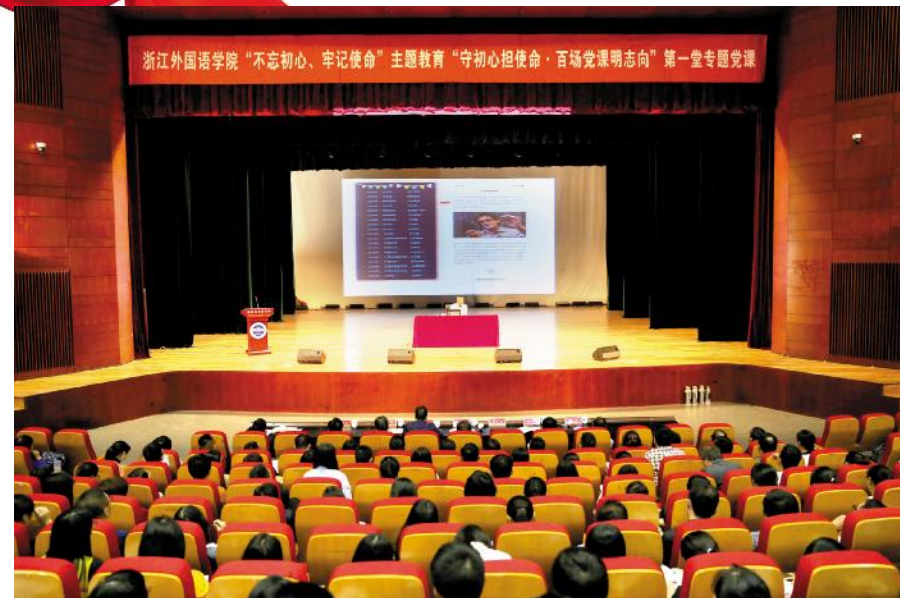
宣勇书记在讲台上进行党课演讲。