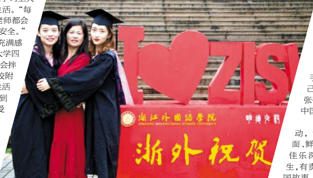
记者：孟珂 魏双双 陶诗怡