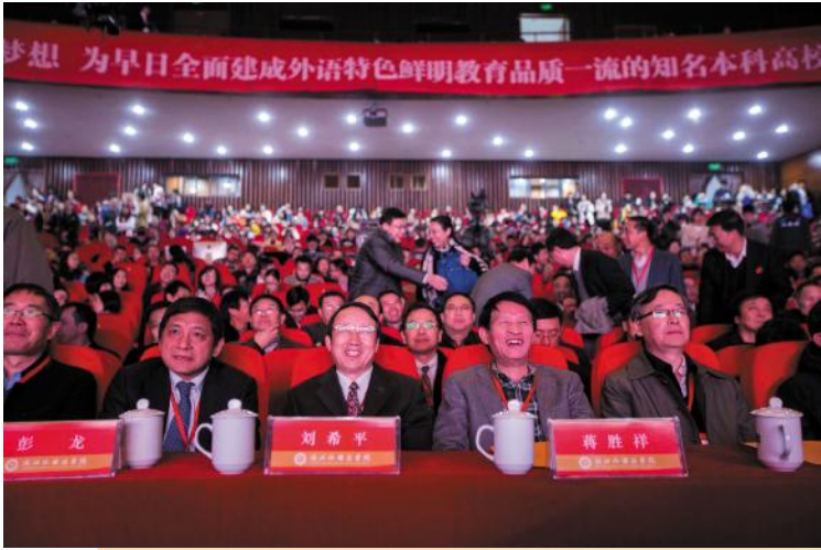
浙江省教育厅厅长刘希平、原副厅长蒋胜祥出席纪念会