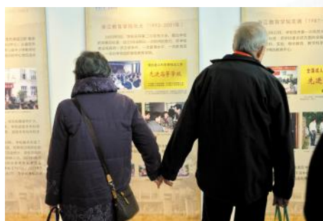
嘉宾观看建校60周年 建校史图片展