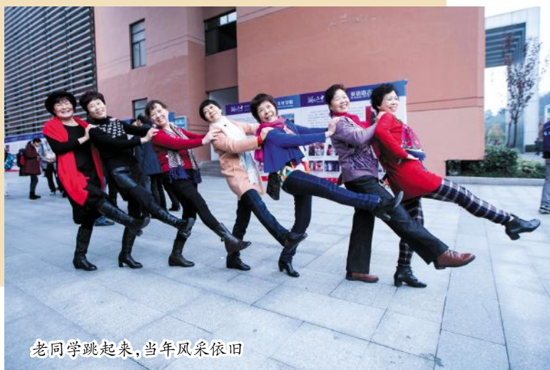
老同学跳起来,当年风采依旧