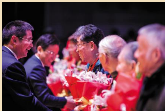
书记、校长为老教师颁奖