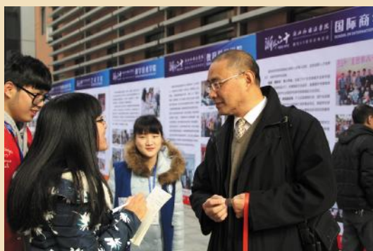
学生记者采访校友