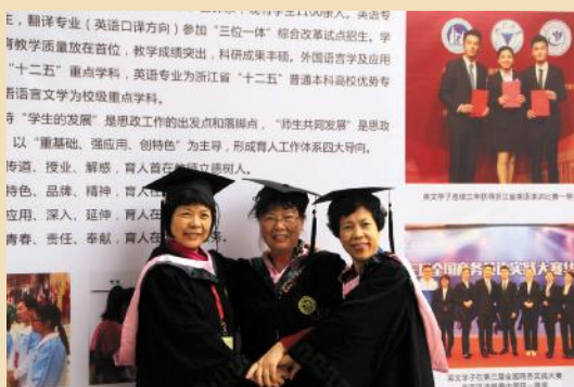
回到母校,再次穿上学位服