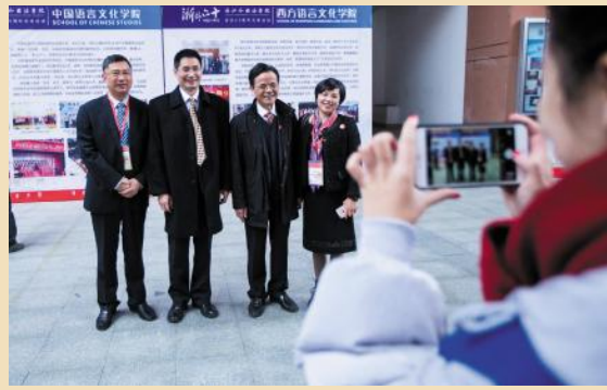
书记、校长与兄弟院校嘉宾合影留念