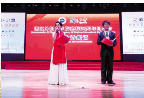
《浙外,我爱您》学生诗歌朗诵