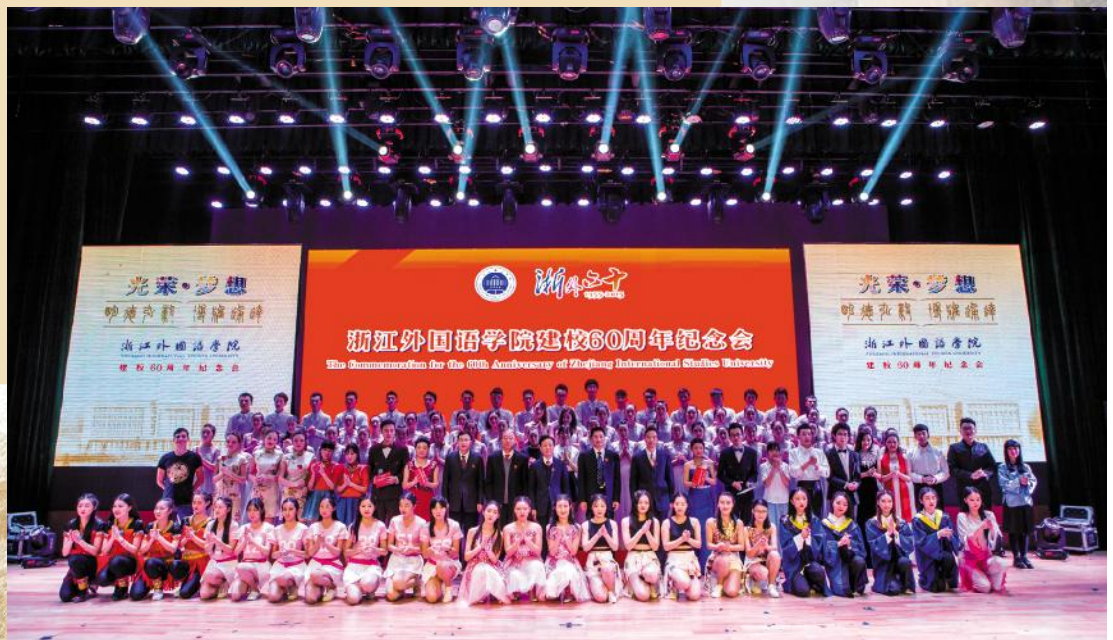
建校60周年文艺晚会，校领导与演职人员合影留念