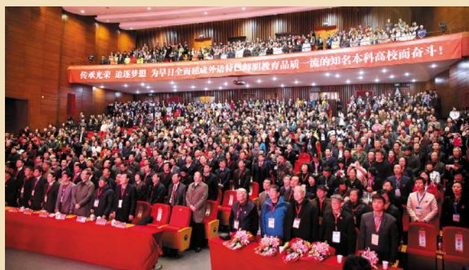
千人同唱浙外校歌