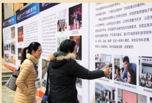
校友观看各学院风采展