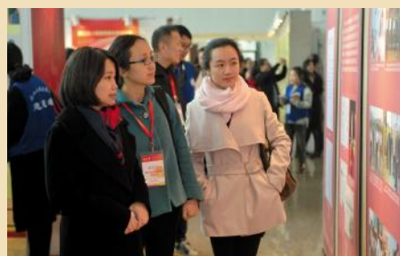
学生认真翻看学校宣传图册