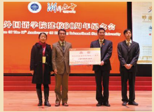
上海外语教育出版社给我校捐赠外文原版图书