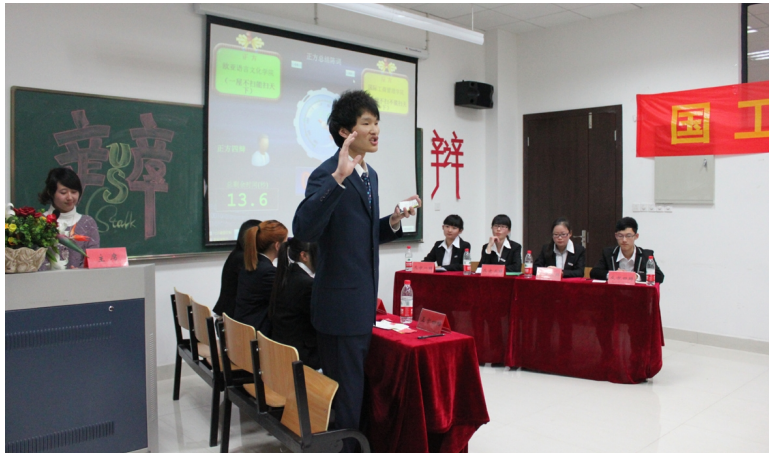
4月11日,学校第十七届辩论赛圆满落幕。经过正反双方的激烈辩论,最终国际工商管理学院辩论队夺冠。(本报记者 岑)