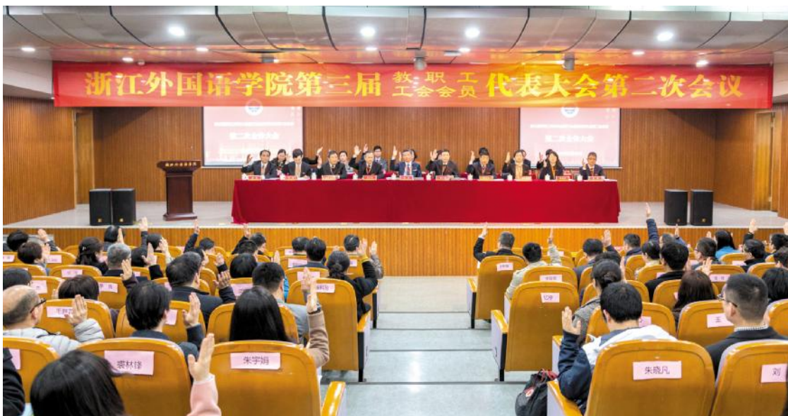
3月29日,浙江外国语学院第三届教职工代表大会暨工会会员代表大会第二次会议顺利召开。图为代表们认真讨论、审议学校工作报告。