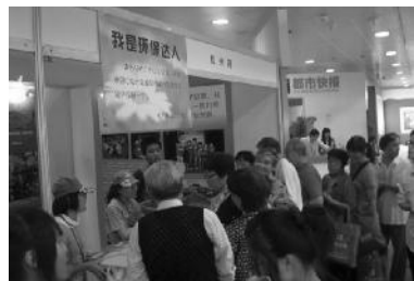
义工招募现场人潮涌动

学校体育工作和人才培养的特色,在各种体育活动中提高学生身体和心理素质。目前,学校民族传统体育运动队和社团发展已经相对成熟,在第七届浙江国际传统武术比赛中取得了优异成绩。我校还被批准为浙江省高校唯一的涉外传统武术教练员培训基地。这是我校改制成功后,体育部为适应学校发展、加强国际交流,形成外语类学校体育工作特色的一个新举措。 其他各学院、部门和直属单位也都结合自身实际,制定了各具特色的活动方案,深入开展调研学习,形成了人人关注、人人参与的良好氛围。