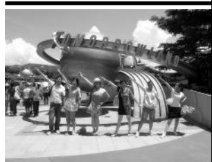
pose——心情和天气一样明媚