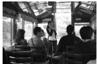
景区讲解实践苦中有乐

在光与影的魔术变幻中,忽然有一种错觉,真实的、虚构的故事都在渐渐隐去,取而代之的是真实的鲜活的一张一张热情的笑脸。像我们这样一群原本只是在网络上谈天说地的人,因为一条路、一个故事、一段回忆而相聚在一起。做同一件事情,走同一条路,品尝同样的路边美食,为同一个故事而付出真实的感动……这些又构成了关于舟山东路的新温暖回忆。光影记录的只是虚拟重现的场景,但真实的感动永存心中。