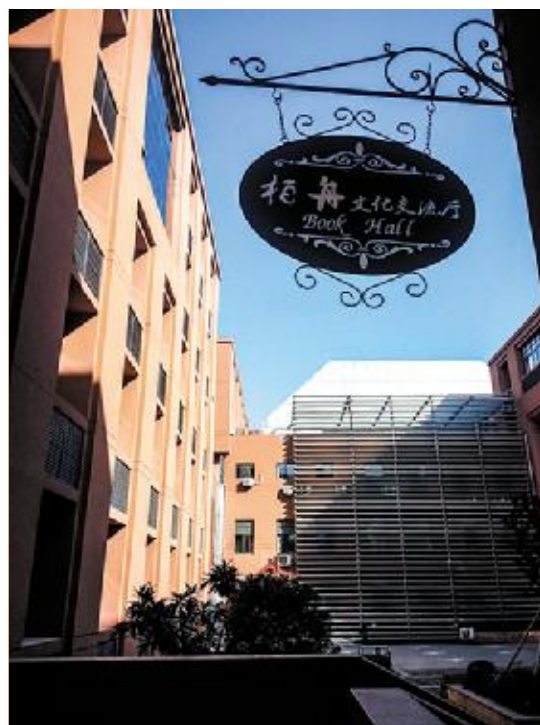
泛彼柏舟,书海沉浮;静言思之,奋飞鸿鹄。 13 设计 1班 楼钟珩