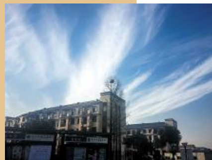
青空云飞羽,白雀楼开屏。 13 设计 1班 楼钟珩