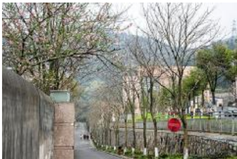
翻墙丛木,新叶间桃花;道旁相迎,虬枝曲榭。 13 设计 2班 毛泽飞