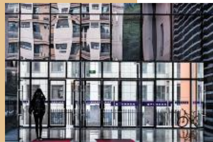
墙面如水面,微风吹皱;行人似行画,掩面轻笑。 13 翻译 1班 潘甜