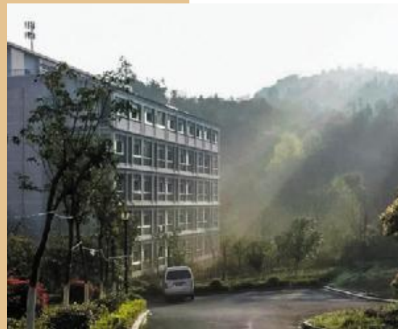
青山涤余霭,灰暖微霄。 12 日语 2班 潘闻