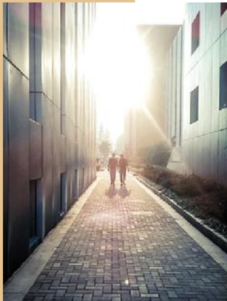
夕阳照人影,日晚朝气新。 13 日语 2班 洪荔