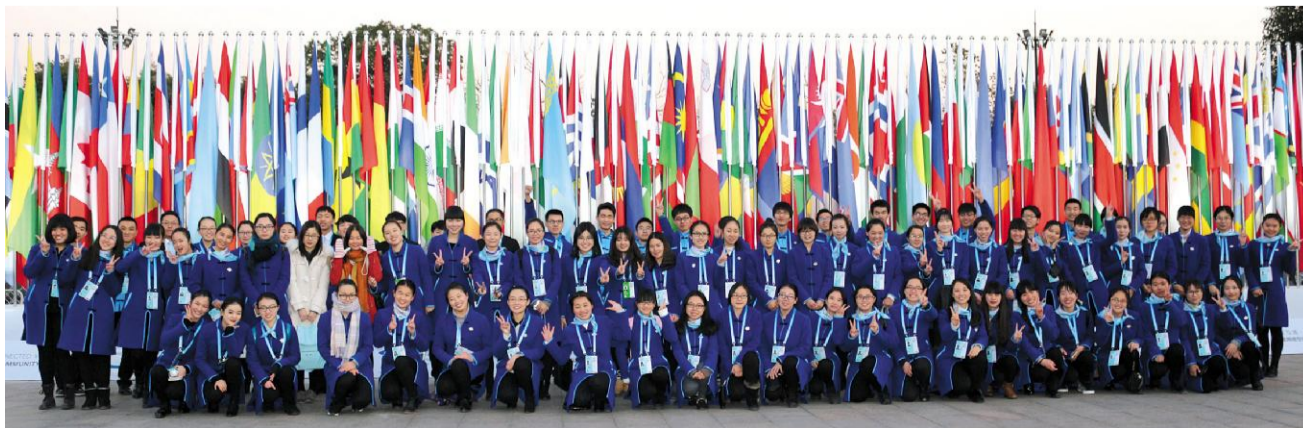
→第二届世界互联网大会期间,我校9个语种专业近180名学生为大会提供了专业、优质的语言服务。我校志愿者表现优异,获得了中央电视台等多家主流媒体的关注。