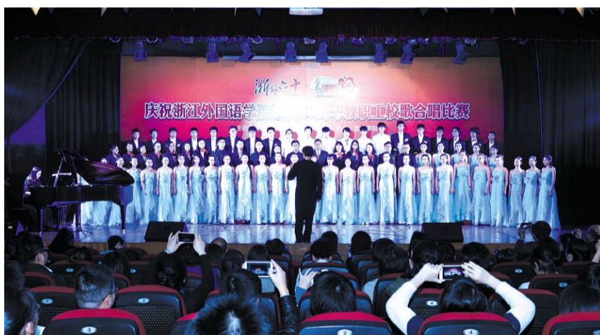
↑2015年,在全校师生的共同参与下,《浙外校歌》谱成。人人学校歌,人人唱校歌成了校园里一道独特的风景。图为11月19日,学校举行建校60周年校歌合唱比赛。