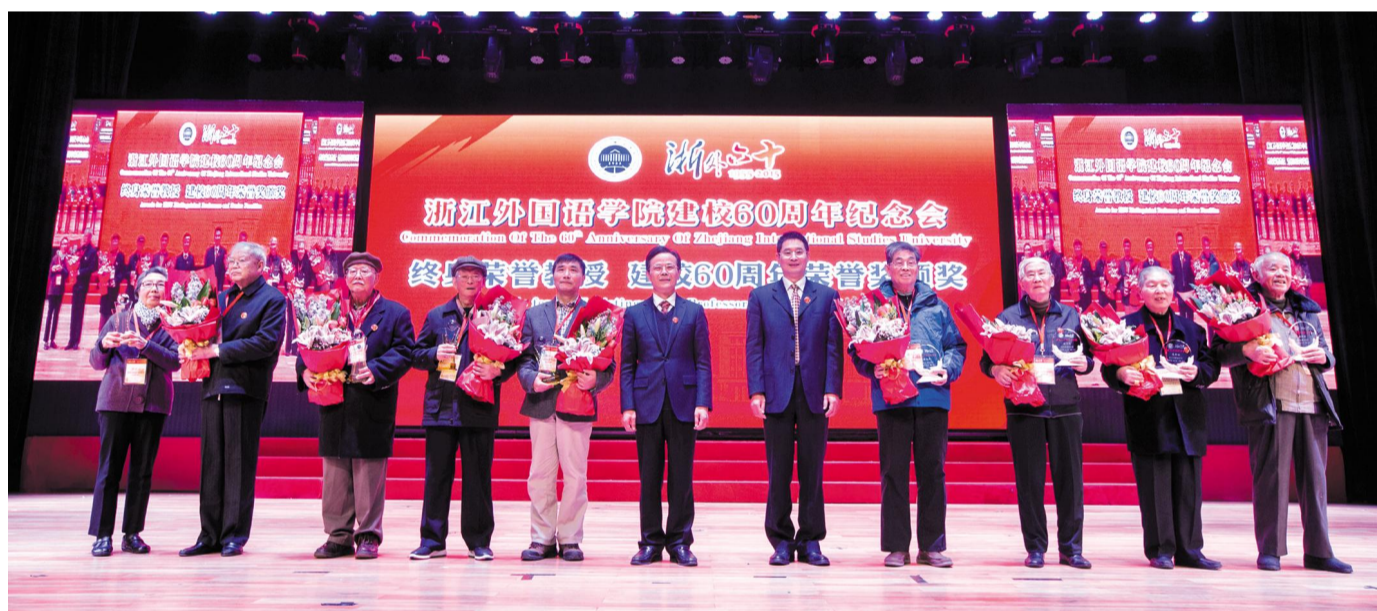
↑11月28日,学校举行了建校60周年纪念会,场面隆重而温馨,所有浙外人都被这份浓浓的浙外情深深打动。图为书记、校长为终身荣誉教授和浙外第一批建设者颁奖。