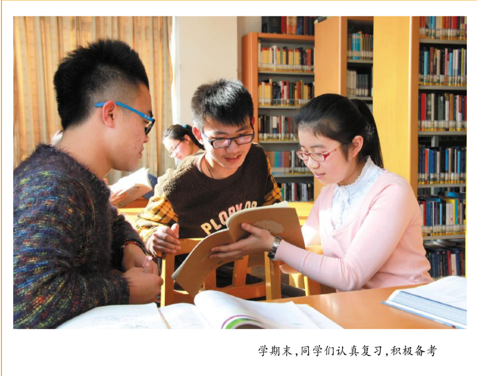
学期末，同学们认真复习，积极备考