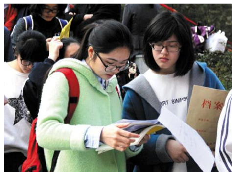
←2015年,我校三位一体招收翻译(英汉口译方向)专业25人,报考人数和参加面试人数较往年都有了大幅度的增加。图为考生在候考。