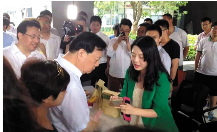
↑我校学子创业项目吸引省委书记夏宝龙关注。2015年,我校多项学子创业项目获社会广泛关注,创新创业在浙外校园里掀起新浪潮。学校为学子创业搭建多种平台,12月在义乌商贸城建立首个大学生创业孵化基地。