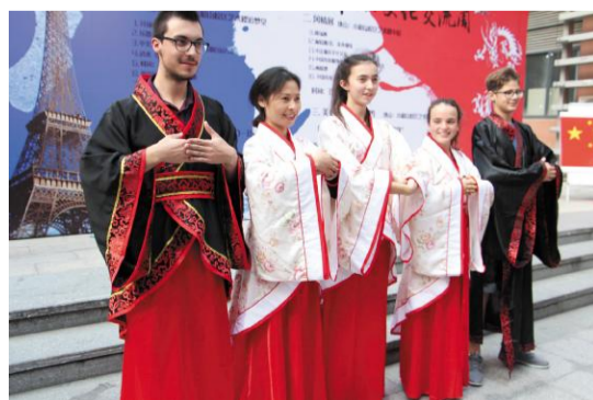
↑2015年,学校共招收长期留学生48名,新增摩洛哥、苏丹、波兰等10个生源国;接待短期学生交流团组69人次。浙外校园里,中外学生一起学习共同成长的画面成为一道亮丽的风景线。图为第二届中法文化交流周上法国学生学习中国传统礼仪。