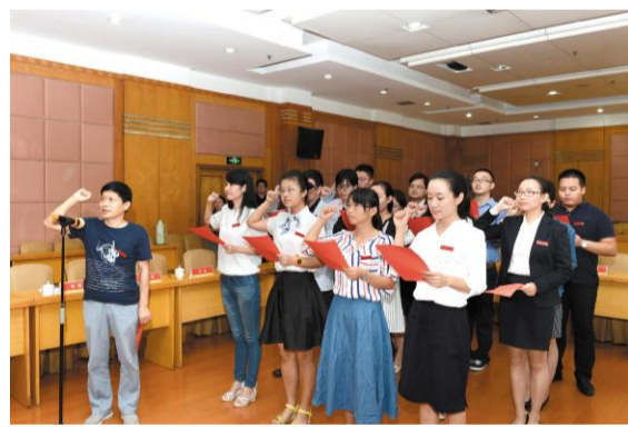
↑2015年,学校引进了53位新教师,近80%的新进专任教师拥有博士学位。图为新教师进行入职宣誓。