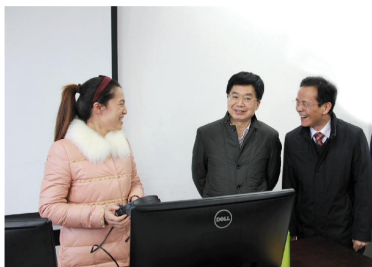
↑11月26日,郑继伟副省长来我校视察,希望学校进一步做好“外语特色鲜明,教育品质一流”这篇大文章。图为郑继伟副省长考察我校同声传译实验室。