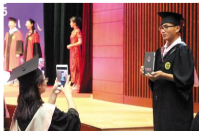
←6月,1507名毕业生走出浙外校园,迈向社会大舞台。浙外毕业生因专业能力强、综合素质高广受社会认可。