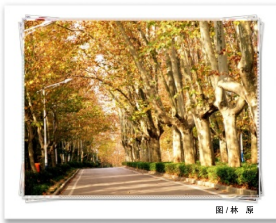
图 / 林原

如果分开了就忘记了，那这友谊的本身也就太脆弱了。真正的朋友是不会忘记的，哪怕十年后，我们改变了太多，偶然相遇在哪棵树下，哪条路上，我们一定还能相认——心的温度是不会改变的。有时感觉，她们其实就在身边。